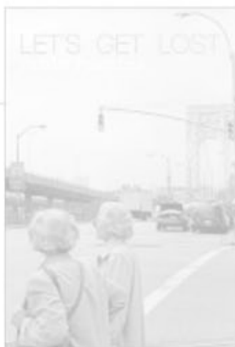
PABLO FUENTES Let's get lost ▶ Col·legi Major Rector Peset. Plaça Forn de Sant Nicolau, 4, València.

UNIO MUSICAL L'HORTA DE SANT MARCEL·LI ▶ Músico Cabanilles, 48. ▶ Fotografías de Miguel Hernández . Hasta el 29 de octubre.